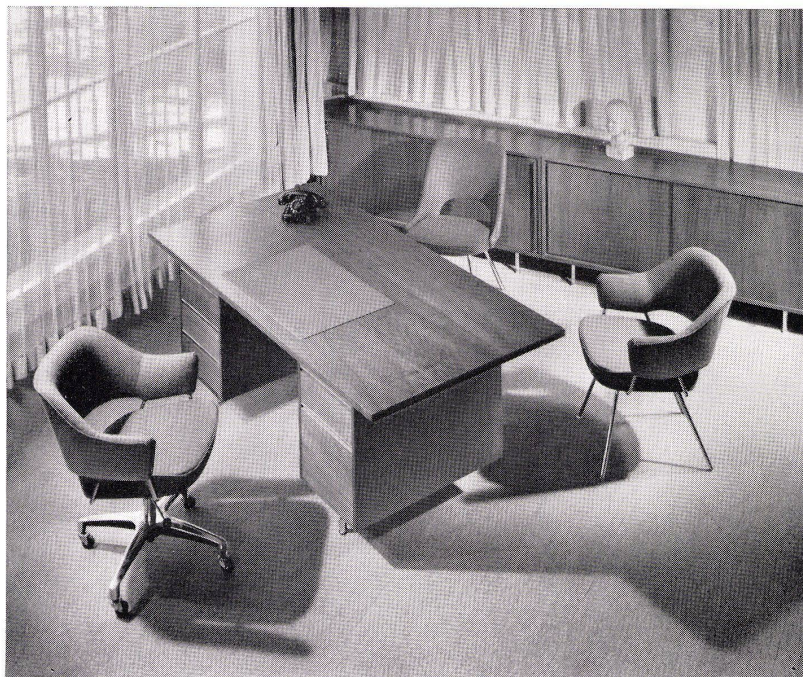
futura Büromöbel - für neuzeitliche Direktionsbüros und Konferenzräume

Ausstellung und Verkauf bei 30 offiziellen Vertretungen. Bezugsquellennachweis durch die Fabrikanten: Girsberger Co Stuhl- und Tischfabrik Bützberg/BE Aebi & Cie Möbelfabrik Huttwil/BE