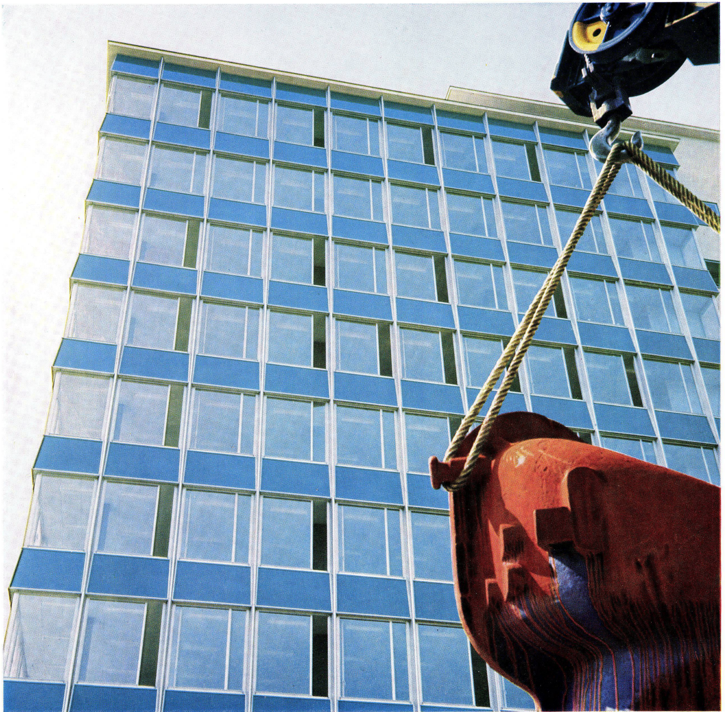
Bürohaus BBC Baden mit unserem Fenstermodell 700