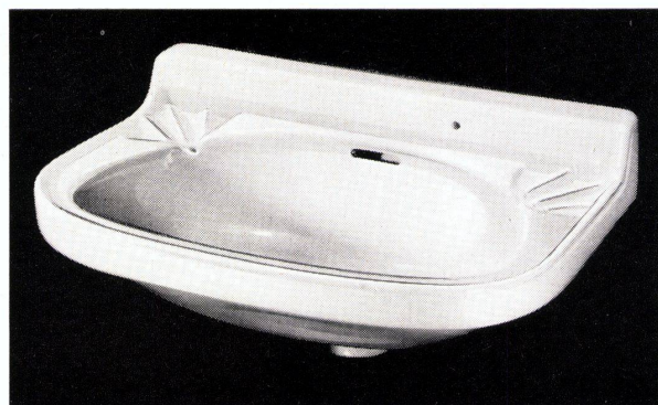
Wandbecken «STAR» Nr. 7325, 49 x 32 cm

tischgruppe entwurf hans eichenberger platte in drei verschiedenen grössen ganz mit «textolite» verkleidet nussbaum oder eiche furniert säulenfuss stahlrohr verchromt stuhl stahlrohr verchromt rück- und armlehne mit naturjunc umwickelt polster mit schwarzem «boltaflex»-bezug prospekt auf anfrage