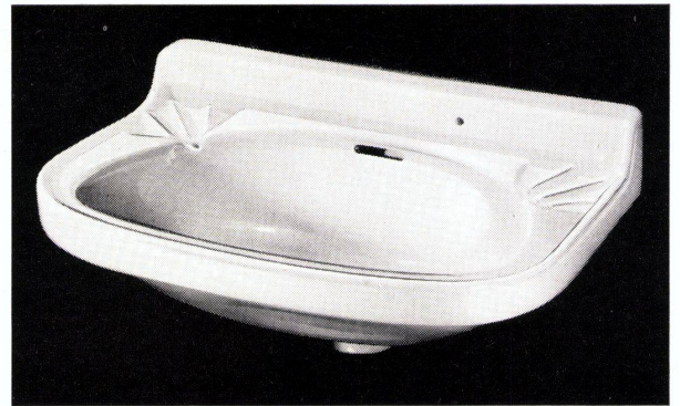
Wandbecken «STAR» Nr. 7325, 49 x 32 cm

tischgruppe entwurf hans eichenberger platte in drei verschiedenen grössen ganz mit «textolite» verkleidet nussbaum oder eiche furniert säulenfuss stahlrohr verchromt stuhl stahlrohr verchromt rück- und armlehne mit naturjunc umwickelt polster mit schwarzem «boltaflex»-bezug prospekt auf anfrage