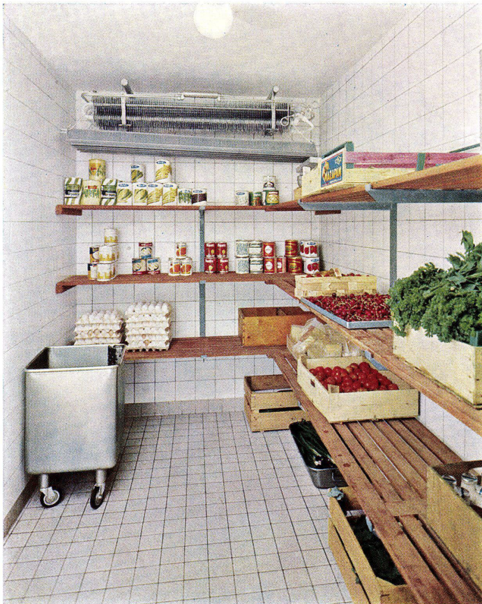
Kühlraum im Klubhaus der Schweizerischen Rückversicherungs-Gesellschaft

werden nicht nur der dekorativen Gestaltungsmöglichkeiten und der reichen Farbauswahl wegen bevorzugt, sondern sie finden überall dort Verwendung, wo höchste Anforderungen gestellt werden an: