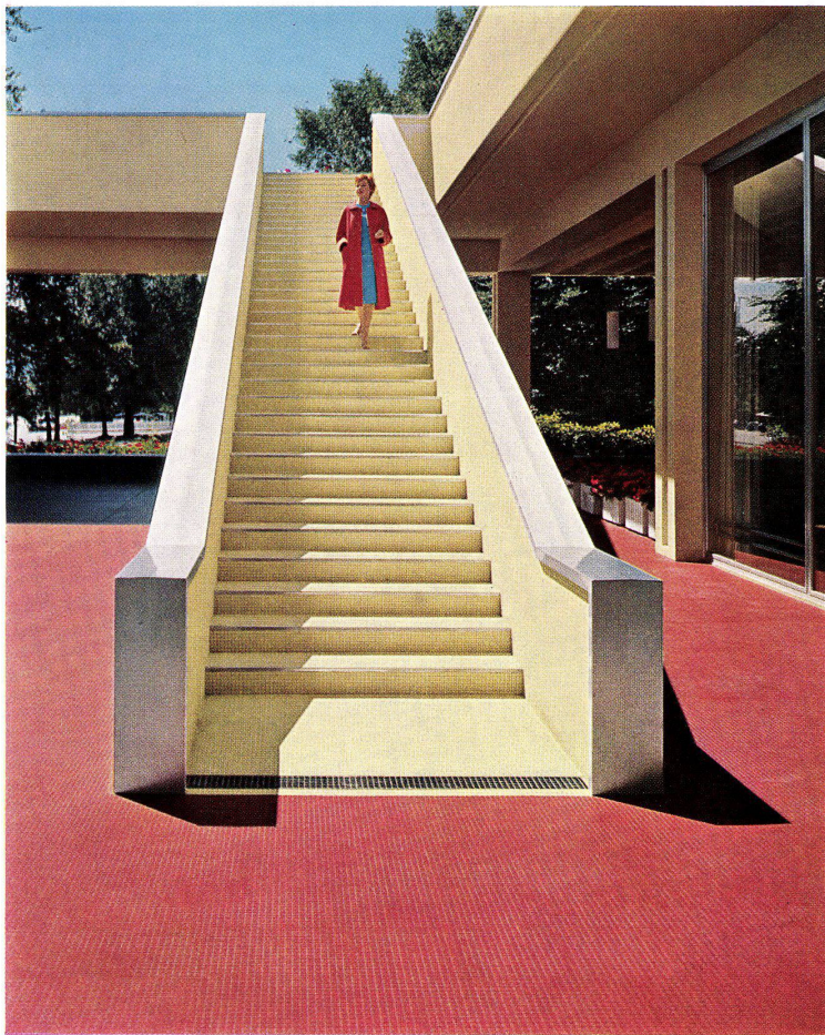
Freitreppe im Klubhaus der Schweizerischen Rückversicherungs-Gesellschaft