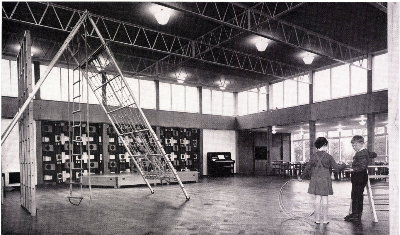
Die als Turnhalle und Aula verwendete »Assembly Hall«, im Hintergrund der Eßraum. La salle de fêtes utilisée comme salle de gymnastique et de fêtes; au fond la salle à manger. The Assembly Hall used as gymnasium and auditorium, in background dining-room.