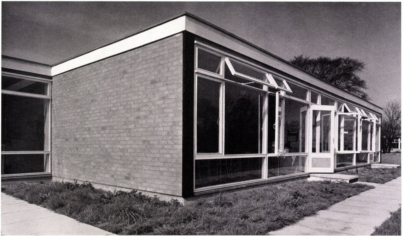
Eine Doppelklasseneinheit. Ausgänge direkt ins Freie. Une unité à double classe. Accès directs vers l'extérieur. A double classroom. Exits directly to outdoors.