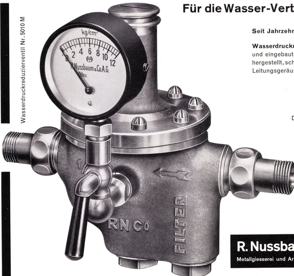
Wasserdruckreduzierventil Nr. 5010 M

Armaturen für Kalt- und Warmwasser, Dampf, Öl, Preßluft, Gas, Vacuum usw. für die gesamte sanitäre Installationsbranche, für die Industrie, für Gas- und Laboreinrichtungen