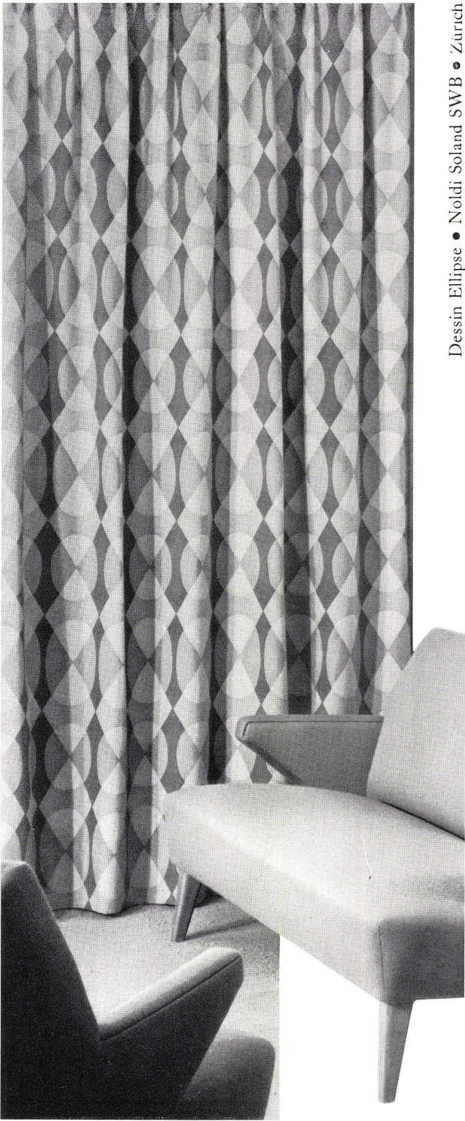
Dessin Ellipse • Noldi Soland SWB • Zürich