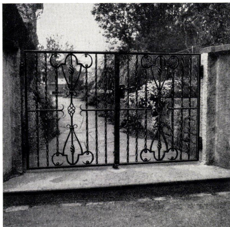
Nach der Vollbadverzinkung noch patiniert

Genossenschaft Hammer Eisenbau Zürich 3 Telephon 331818