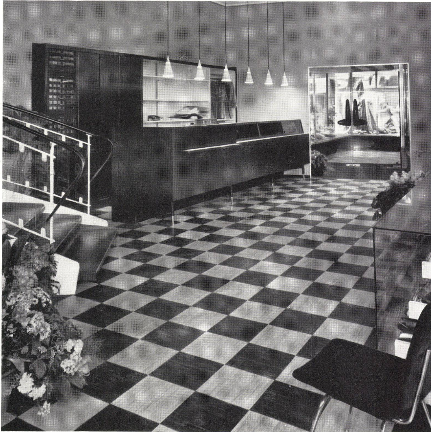
Modehaus „Spira“, Basel