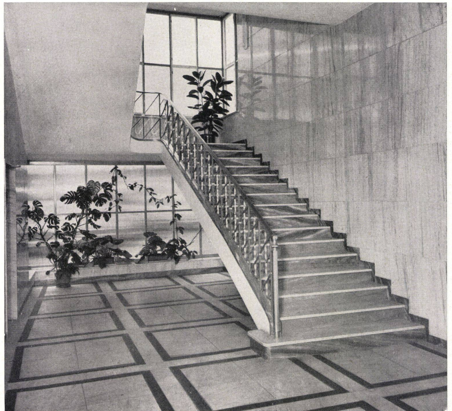
Großgeschäftshaus in Zürich. Typen: Virginio C 6