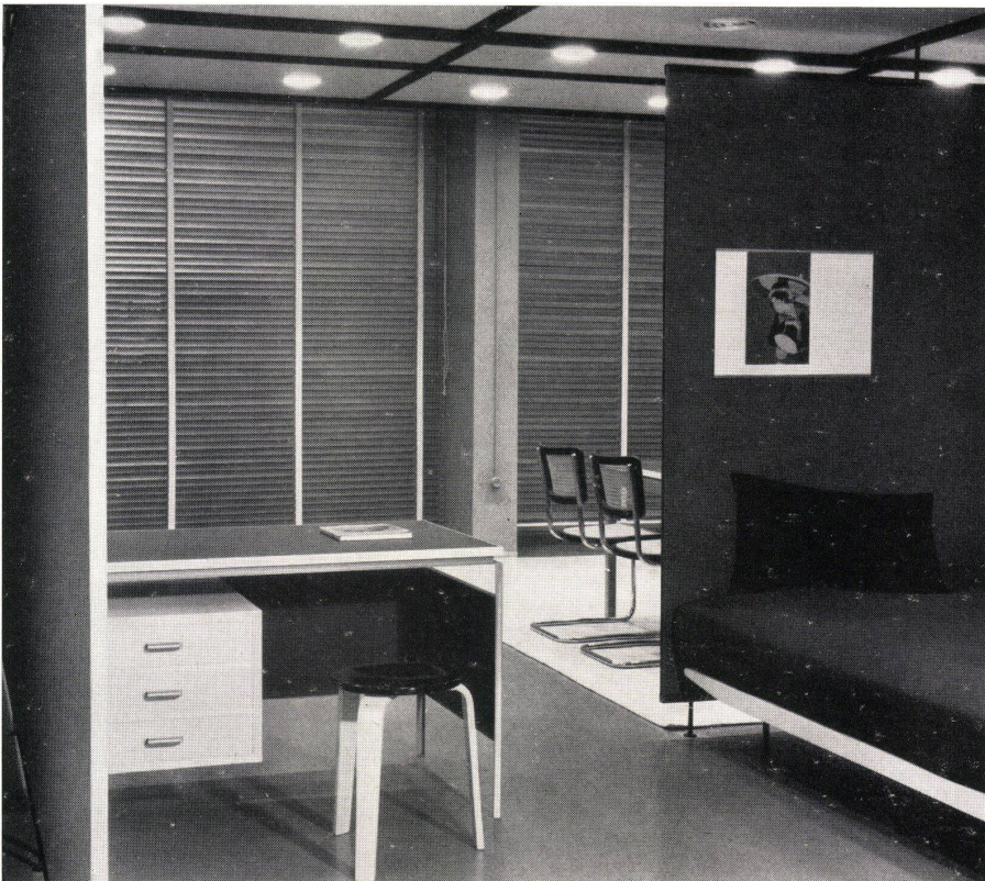
Blick gegen die Schaufenster. Schreibtisch von Kurt Thut, Zürich. Vue des vitrines. Secrétaire de Kurt Thut, Zurich. View towards the shop windows. Writing desk by Kurt Thut, Zurich.