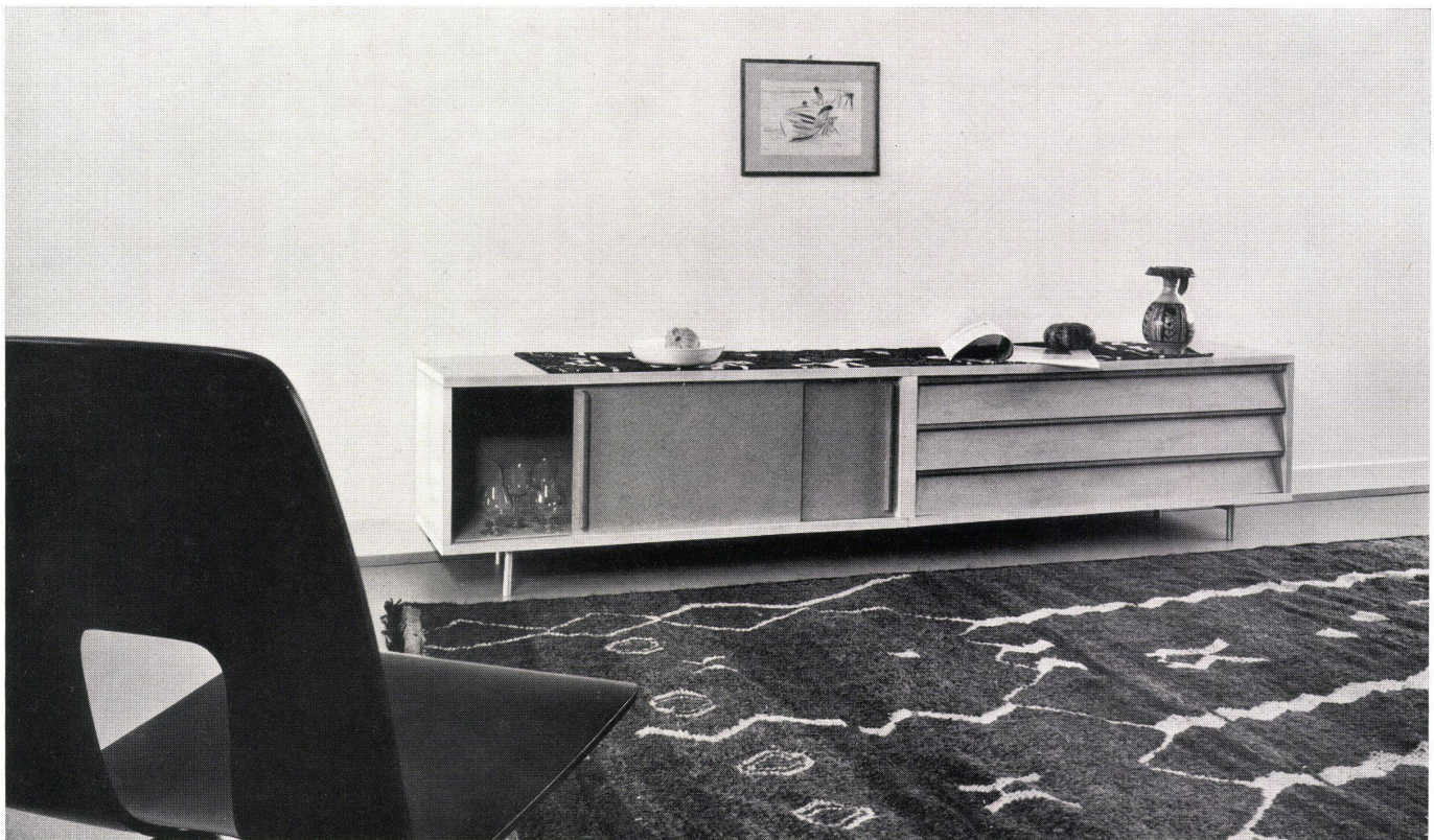
Zusammenbau von Brett-, Schubladen- und Türelementen zu einem niedrigen Buffet. Buffet bas composé d'éléments de planchettes et de portes. Assembly of board, drawer and door elements for a low sideboard.