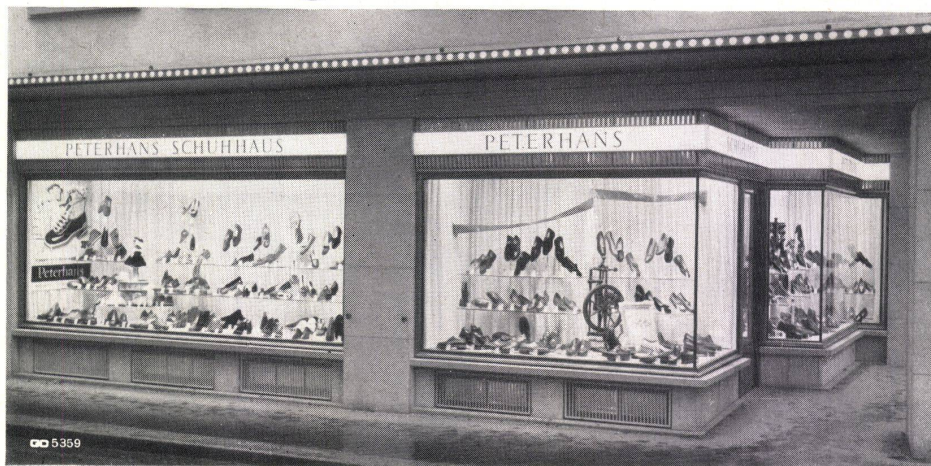
Geilinger & Co. Winterthur