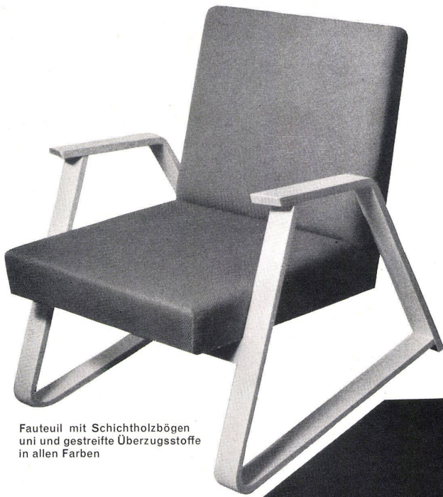
Fauteuil mit Schichtholzbögen uni und gestreifte Überzugstoffe in allen Farben