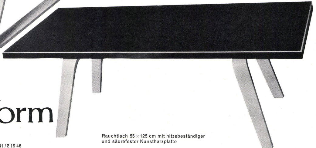
Rauchtisch 55 x 125 cm mit hitzebeständiger und säurefester Kunstharzplatte