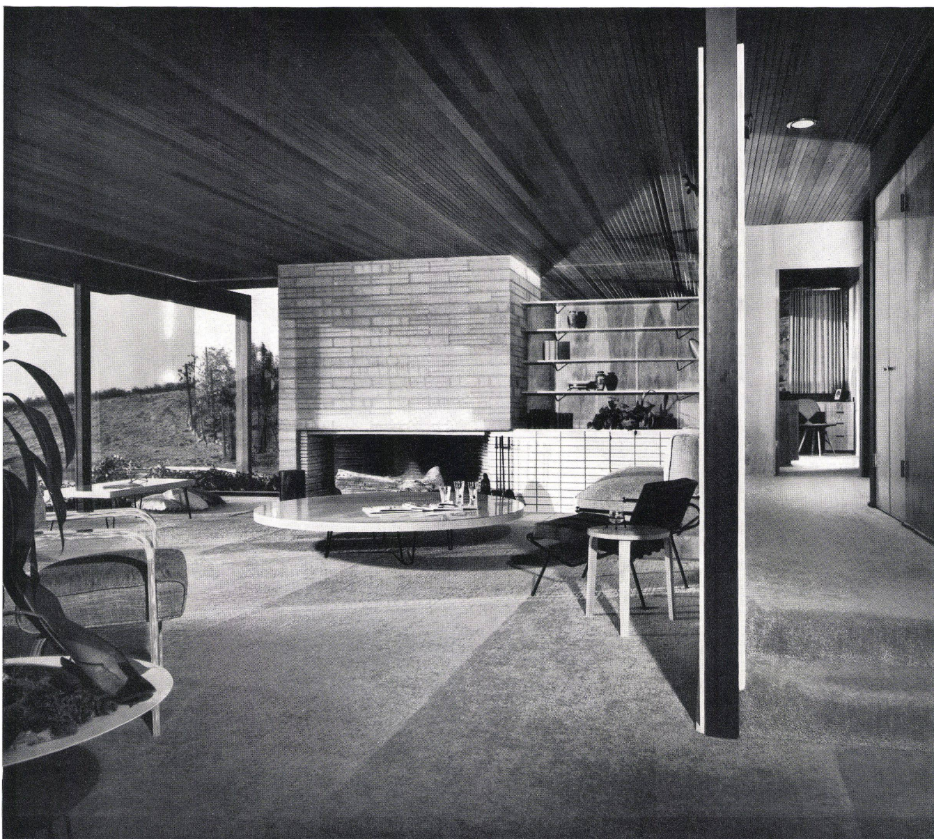
Wohnzimmer mit Cheminée wand. Salle de séjour avec paroi de la cheminée. Living-room with fire place wall.