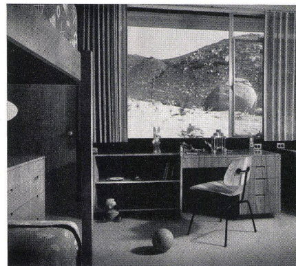
Kinderzimmer. Chambre d'enfants. Children's room.

Unterbau Stampfbeton. Bodenkonstruktion Eisenbeton mit Fußbodenstrahlungsheizung. Wände und Decken in Holzskelett, außen verputzt, innen zum Teil in Birke getäfelert, zum Teil verputzt. Deckentäfer in Redwood. Zie.