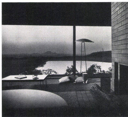
Links / A gauche / Left: Blick vom Wohnraum mit dem Cheminée auf das Spiegel- bassin. Vue de la salle de séjour avec cheminée sur le bassin. View from living-room with fireplace to the pool.