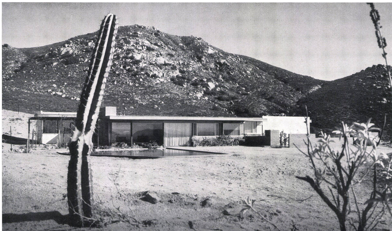
Gesamtansicht von Westen. Vue de l'ouest. Overall view from the west.