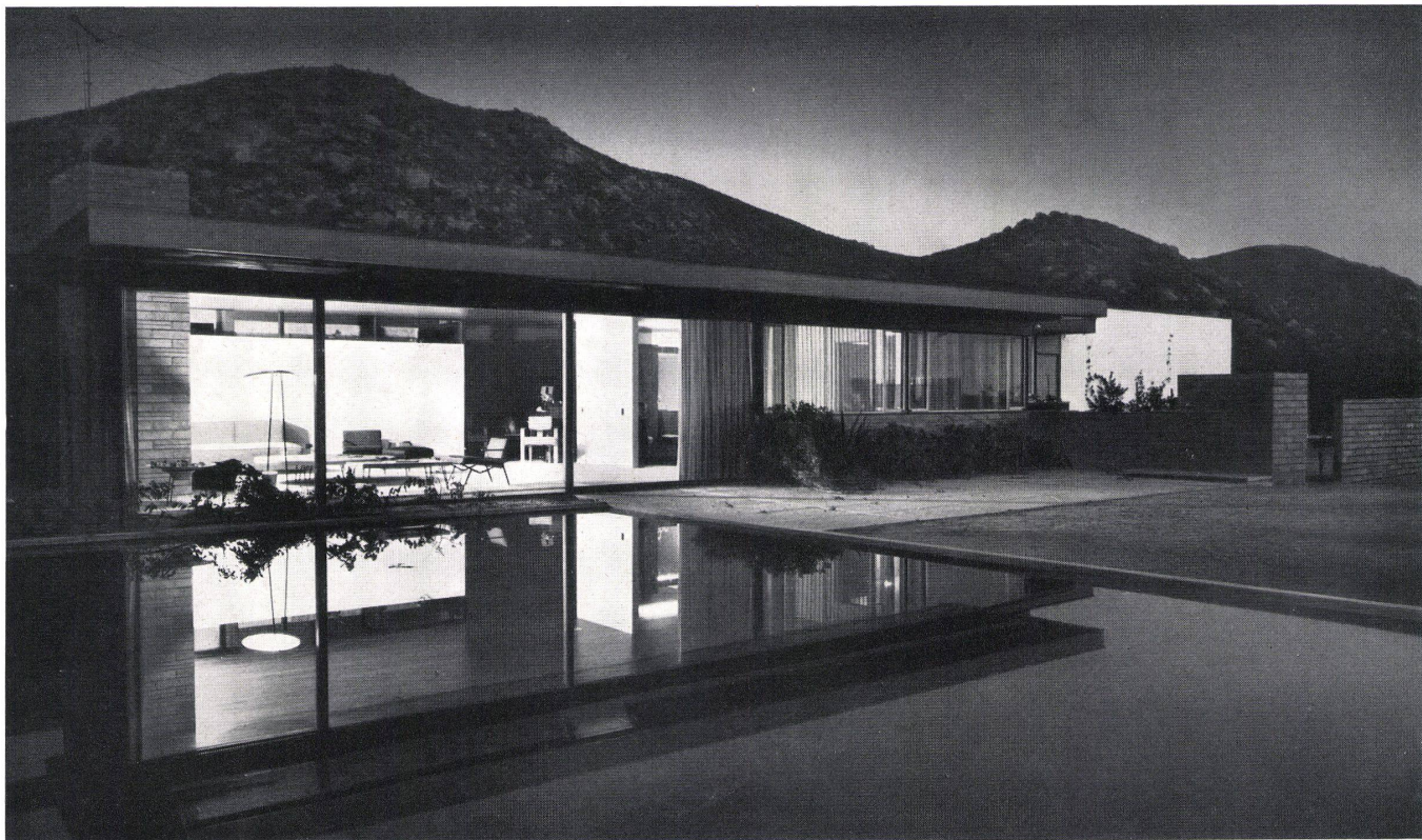
Nachtaufnahme mit Blick ins Wohnzimmer. Vue prise de nuit sur la salle de séjour. Night photo with view into living-room.