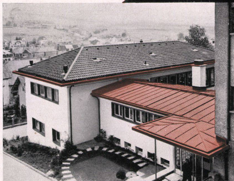
für sämtliche Spenglerarbeiten

SEIT JAHRHUNDERTEN BEWÄHRT UND HEUTE NOCH BEGEHRT