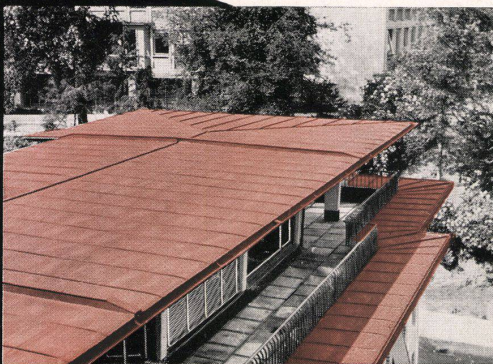
für Bedachungen aller Art