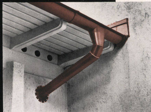
für Dachrinnen und Ablaufrohre

KUPFER wählen beweist Geschmack und kluge Voraussicht. Im Gebrauch erweist es sich als der ideale Baustoff, in welchem Dauerhaftigkeit und Schönheit vereinigt sind. Kupferarbeiten sind