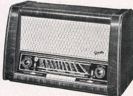
Mod. 174 W