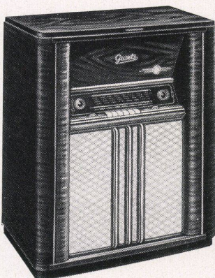
Mod. 178 W