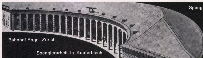
Bahnhof Enge, Zürich

die unbrennbare Platte für Akustik, Ventilation und Strahlungsheizung