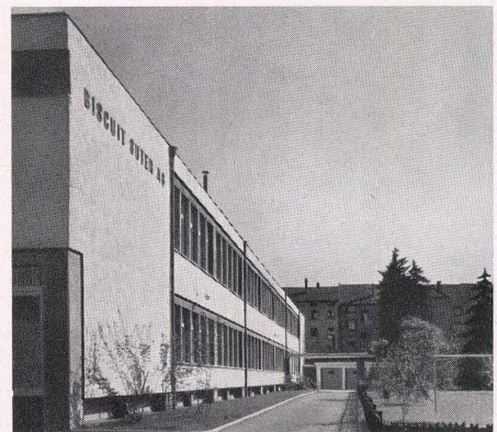
Blick von der Straße gegen den Eingang. Vue de la rue sur l'entrée. Street view towards the entrance.