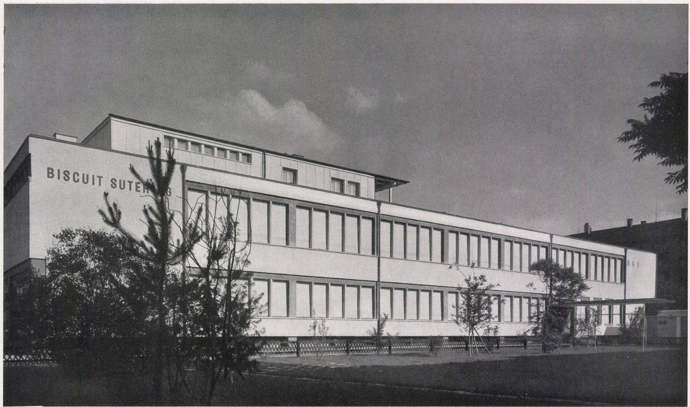
Gesamtansicht. Vue générale. Overall view.