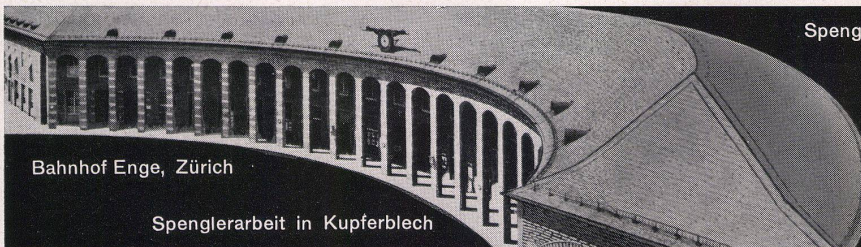
Bahnhof Enge, Zürich

stätte zum Norm-Fenster. Groß- und Detailaufnahmen vermitteln die Vielfalt der einzelnen Arbeitsphasen, aber auch einen vorbildlich organisierten Herstellungsablauf. Zu den eindrucklichsten Bildfolgen gehören hierbei Aufnahmen von einzigartigen Spezialmaschinen, welche zu den neuesten Errungenschaften der Technik zu zählen sind. Der Film wächst förmlich aus den Problemen der fortschreitenden Normierung von Bauteilen heraus, mit welchen er sich eingehend auseinandersetzt. Die filmische Handlung wirkt den ganzen Streifen hin-