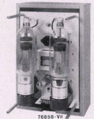
Thyralluxgerät 14 A mit abgenommenem Deckel

Zahlreiche Anlagen im Betrieb Wir beraten Sie gerne