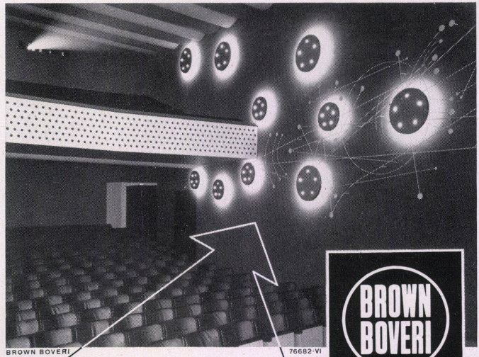
Reguliert mit Thyrallux