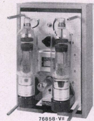
Thyralluxgerät 14 A mit abgenommenem Deckel

Zahlreiche Anlagen im Betrieb Wir beraten Sie gerne