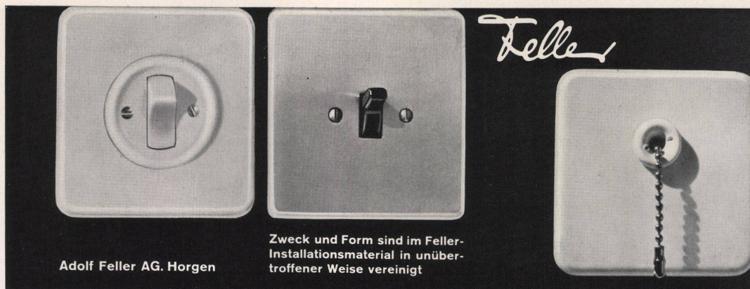
Adolf Feller AG. Horgen

Zweck und Form sind im Feller-Installationsmaterial in über- troffener Weise vereinigt