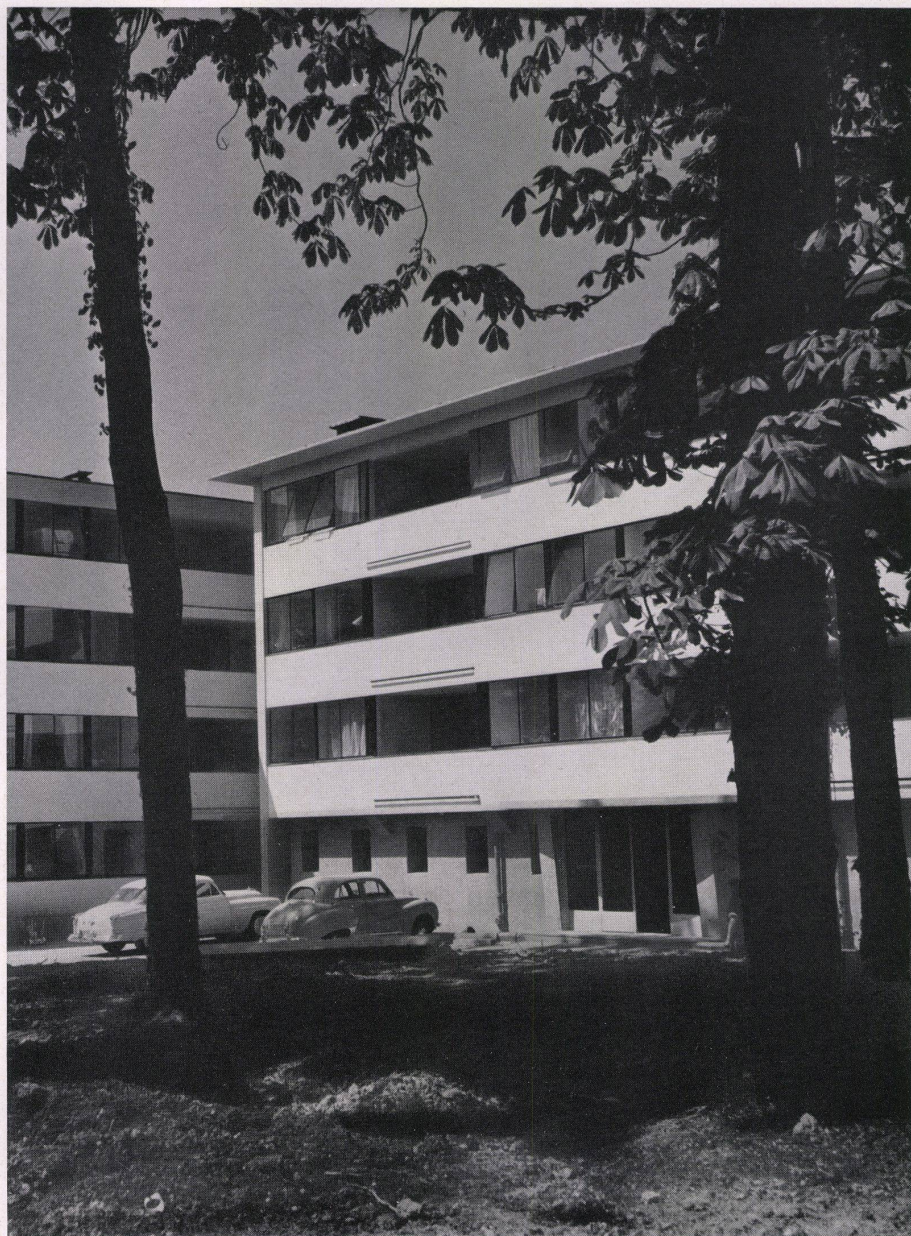
Block 2 und 3. Blocs 2 et 3. Block 2 and 3.