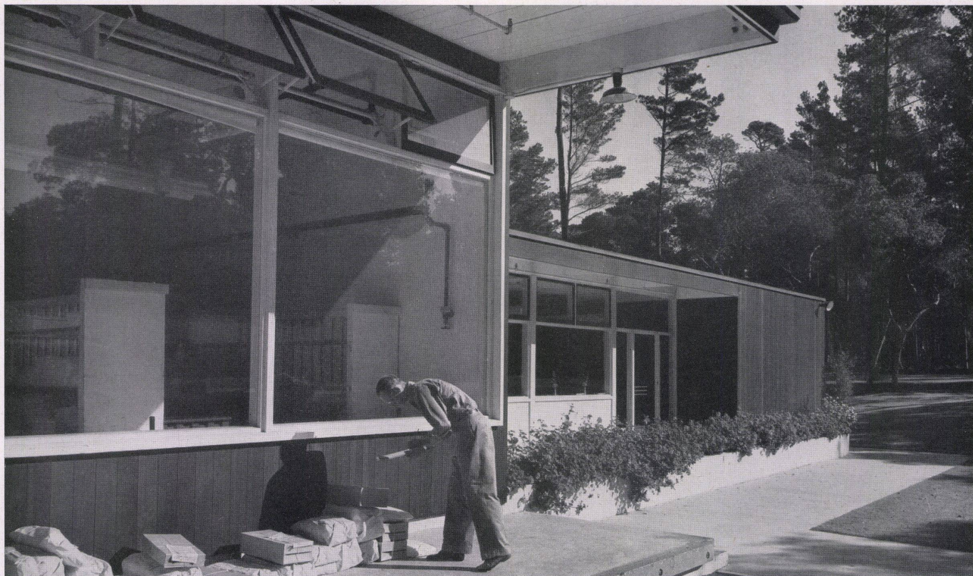
Verladerampe und Ruheterrasse / Rampe de chargement et terrasse de repos / Loading ramp and rest terrace.