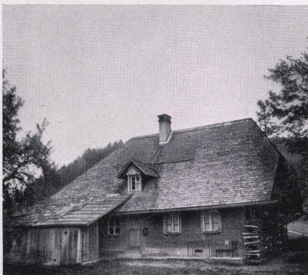
Links Toiletten, rechts Klassenzimmer

Die 111 Klassenzimmer können nur durch Öffnen der Fensterwand korrigiert werden.