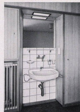
Sanitäre Anlagen Techn. Büro