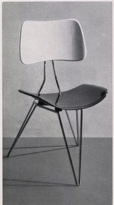
Dreibeintyp mit federnd aufgelegtem und gebogenem Holzsitz.

Modèle à trois pieds avec siège formé bien suspendu. Three-leg type with laid-on and bent wooden seat.