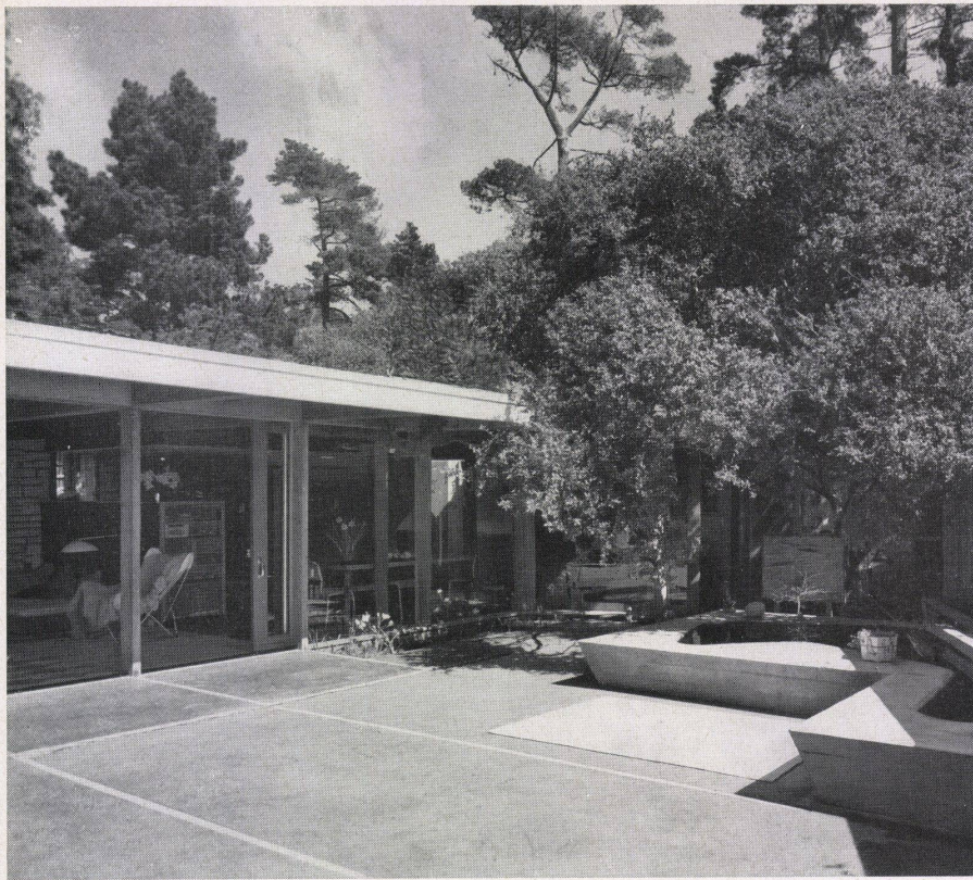
Gartenhof und Blick zum Wohn-Eßraum Cour-jardin et vue sur le living-room / salle à manger Yard, view towards living-cum-dining room