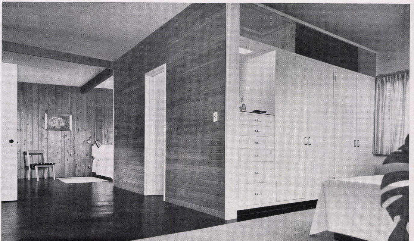
Elternzimmer mit den beiden Schlafnischen und dem Bad- zimmer Chambre des parents, les deux alcôves et la salle de bains Parents' room with two bed niches and bathroom