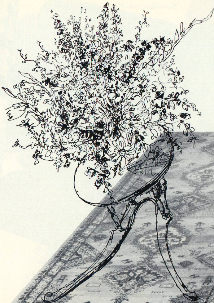
Quadratische oder ganz langgestreckte Formate sind interessanter und lassen sich oft besser verwenden als das übliche 2 x 3-m-Maß. Moquette-Läufer, Dessin Hamedan von Schuster & Co. Zürich - St. Gallen

Aparte Wirkungen muß man ausprobieren; ich glaube nicht, daß man dafür fertige Rezepte geben kann. Das wäre noch schwieriger als bei der Damenmode. In Kleidern macht man eine deutliche Unterscheidung zwischen Abendkleidern, Straßenkleidern und sportlichen Anzügen. Eine Dame erweckt Kritik, wenn sie zu einem festlichen Anlaß im Pullover erscheint, oder eine Bergtour in hohen Absätzen unternimmt, oder zum Pelzmantel Sandalen mit Korksohlen trägt. Erinnern Sie sich dieses Beispiels beim Teppichkauf; denn auch hier gibt es Abstufungen von elegant und kostbar bis zum bauerlichen, robusten, derben Teppich und die Kunst besteht darin, die richtige Übereinstimmung zu finden. Legen Sie nicht unter einen schweren Eßtisch einen feinen Bochara oder vor ein spitzfüßiges Louis-XV-Möbel einen zottigen Berberteppich. Legen Sie nicht vor ein geradliniges Typenmöbel ein verschnörkeltes Muster oder unter geflochtene Tessinerstühle einen seidenglänzenden Uni-Teppich. Legen Sie nicht unter eine Tischgruppe mit Eckbank einen Teppich mit Mittelstück. Legen Sie nicht in ein fades Zimmer einen noch faderen Teppich. Beige Tapete, beige Vorhänge und beigefarbener Teppich stören nicht, sind aber auch nicht