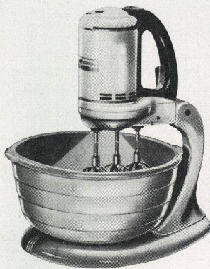
Der G-E Portable Dreischlag-Mixer

Der G-E Portable-Mixer schlägt Eier, schwingt Rahm, mischt Teig, preßt Fruchtsäfte und besorgt viele andere Küchenarbeiten sorgfältig und rasch. Mühelos mischt er in der gewählten Geschwindigkeit jedwede Ingredienzen, ungeachtet der Menge oder deren Dicke. Der G-E-Mixer ist der einzige Apparat dieser Art mit drei Schwingern. Der beim Griff handlich angebrachte Mehreinstellungsschalter ermöglicht ein bequemes einhändiges Einstellen auf die verschiedenen Geschwindigkeiten. Der weiße, feuervermaillierte G-E Portable-Mixer ist mit einer geräumigen Schüssel versehen, deren Inneres mit eingebautem Licht erleuchtet werden kann. Der im Ölbad eingebaute Betriebsmechanismus gewährleistet ein einwandfreies Funktionieren — kein Ölen notwendig. Der Fruchtpresser ist in der Normalausrüstung miteinander geschlossen.