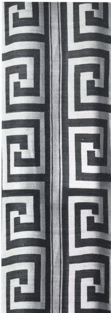
Dessin «Aeschylus» auf «Museumleinen» Dessin «Aeschylus» sur lin Pattern «Aeschylus» on linen