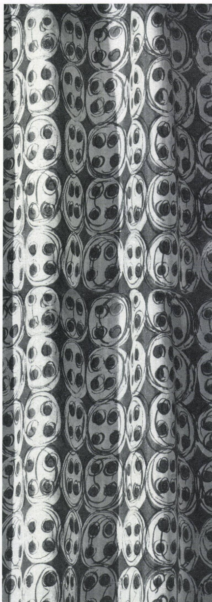
Dessin «Tam Tam» auf Japan-Seide Dessin «Tam Tam» sur soie de Japon Pattern «Tam Tam» on Japanese silk

Wenn heute der einfachen, linearen Form im bedruckten Stoff wieder in vermehrtem Maße eine Bedeutung zukommt, so liegt der Grund darin, weil die neuen Möbelformen einfacher und klarer geworden sind. Wir wollen dabei aber nicht vergessen, daß gerade der lineare Charakter durch das Wegfallen der schmückenden Elemente eine gründliche Formungsarbeit erfordert.