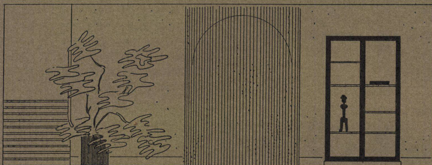
Wandansichten Wohnhalle / Aspects des parois du hall / Hall partitions