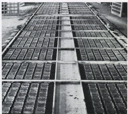
1 Ansicht des Glasbetoneinsatzes des Auslegedaches mit Iperfan-Oberlichtelementen Typ 3050