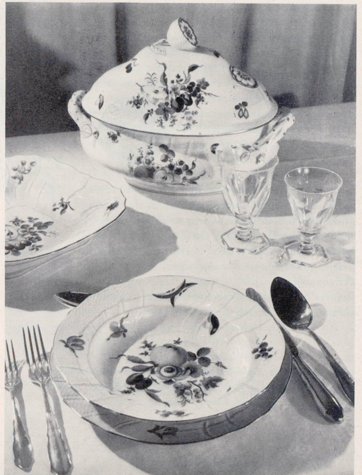
GLAS UND PORZELLAN. AUX ARTS DU FEU, LUZERN - ZÜRICH