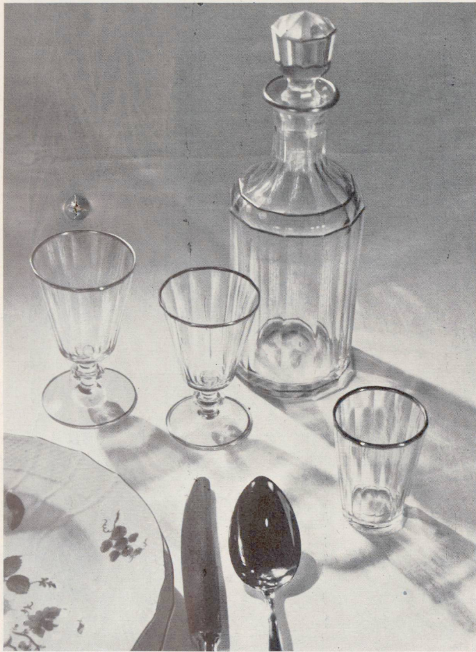
GLAS UND PORZELLAN. AUX ARTS DU FEU, LUZERN - ZÜRICH

Ein geheimnisvoller Zauber liegt über Kristall und Porzellan, ein Zauber, der sich auch der Umgebung mitteilt. Zartes, edles Porzellan, gediegene Trinkgläser sind nicht nur Gebrauchsgegenstände, sondern zugleich ein Schmuck, der den einfach gedeckten Tisch in eine festliche Tafel verwandelt; sie sind auch ein Wertmesser, der sehr viel über den Geschmack des Besitzers auszusagen vermag. Diese scheinbar so selbstverständlichen Gebrauchsgegenstände müssen darum mit besonderer Sorgfalt ausgesucht, mit Liebe und Verständnis zusammengestellt werden; denn ein paar edle Tassen, ein Satz guter Gläser bereiten viel mehr Freude als eine noch so