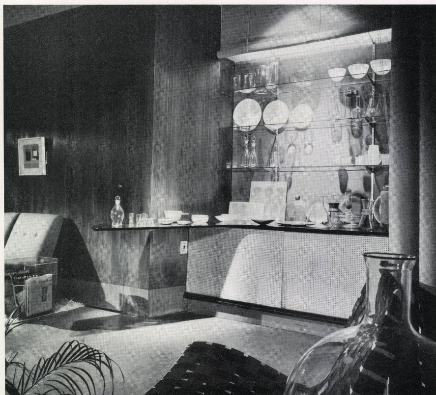
Ausstellung von Glaswaren Exposition d'articles en verre Exhibition of glass ware