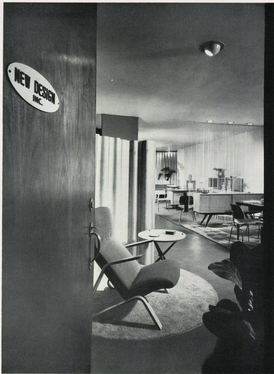
Eingang zu den Verkaufsräumen / Entrée aux salles de vente / Entrance to the salesrooms