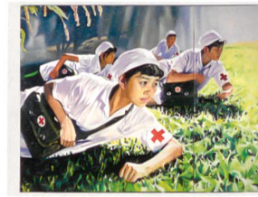
Jing Keven, Dream 2008, N°1 (Nurses), 2008

EXPOSITION CHINESE WHISPERS Œuvres récentes des collections Sigg et M+ Sigg Musée des Beaux-Arts de Berne et Zentrum Paul Klee www.zpk.org