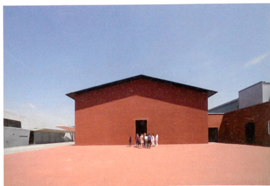
Vitra Design Museum, Julien Lamoo

La collection du Vitra Design compte parmi les plus prestigieuses réserves de meubles design du monde. Elle comprend environ 7000 meubles, plus de 1000 luminaires, de nombreuses archives et legs de designers tels Charles & Ray Eames, Verner Panton et Alexander Girard. Conçu spécialement par Frank Gehry en 1989 pour la présentation de la collection, le bâtiment principal sert aujourd'hui aux expositions temporaires et la collection ne fut plus exposée de manière permanente. Grâce au nouveau bâtiment des architectes bâlois Herzog & de Meuron, la collection peut à nouveau être exposée et mise en valeur. Y sont intégrés un café et un shop. A cette occasion le campus Vitra a créé un deuxième accès que le relie plus directement aux villes de Bâle et de Weil am Rhein.