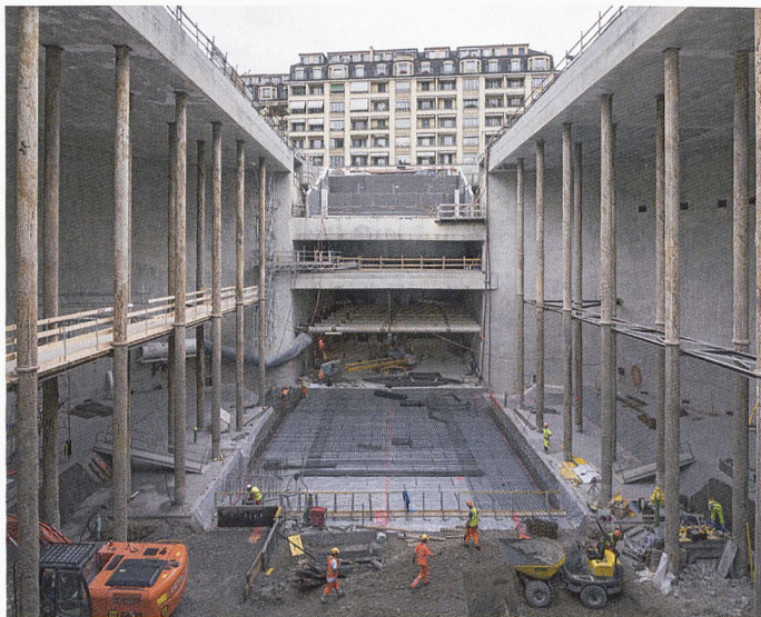
Halte de Champel-Hôpital