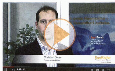
Ego®Fresh, le système d'aération multiloaux compatible avec MINERGIE®

Vidéos de produits: www.egokiefer.ch/innovations