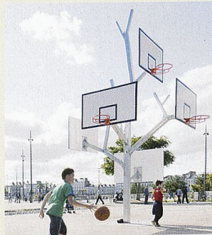
L'arbre à basket, agence a/LTA

MANIFESTATION VOYAGE À NANTES Installations dans l'espace public, Nantes www.levoyageanantes.fr