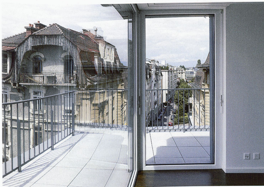
Une isolation phonique efficace à proximité des voies à grand trafic grâce aux fenêtres EgoKiefer.

Les nuisances sonores croissent en Suisse. Aujourd'hui, 17 % des logements sont exposés au bruit. La qualité de l'habitat ne peut qu'en souffrir. EgoKiefer propose pour ses fenêtres et ses portes-fenêtres des solutions optimales dans le domaine de l'isolation phonique.