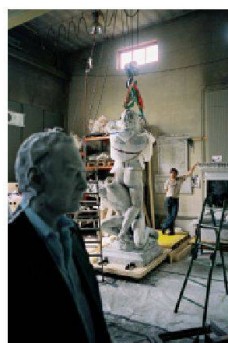
Une œuvre d'Urs Fischer pour la Biennale de Venise en production au Sitterwerk