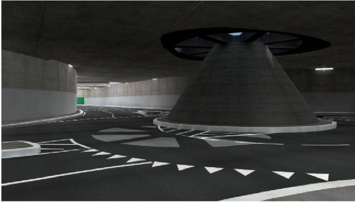
Fig. 6 : Image de synthèse du futur giratoire souterrain de St-Léonard (Etat de Fribourg / About Blank Design Office)