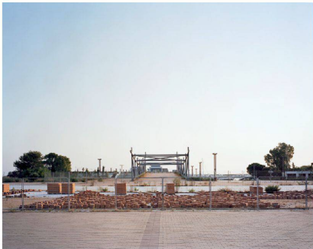
Fig. 13 : Complexe olympique d'Athènes (OAKA)