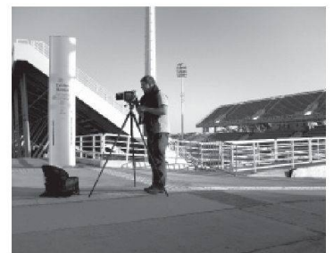
La série Game Over a été réalisée en juillet 2010, dans les principaux sites olympiques d'Athènes. Jürgen Nefzger a utilisé une chambre 20 x 25.