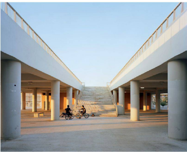
Fig. 4 : Complexe olympique d'Athènes (OAKA)

Fig. 3 : Stade d'entraînement au complexe olympique d'Helliniko