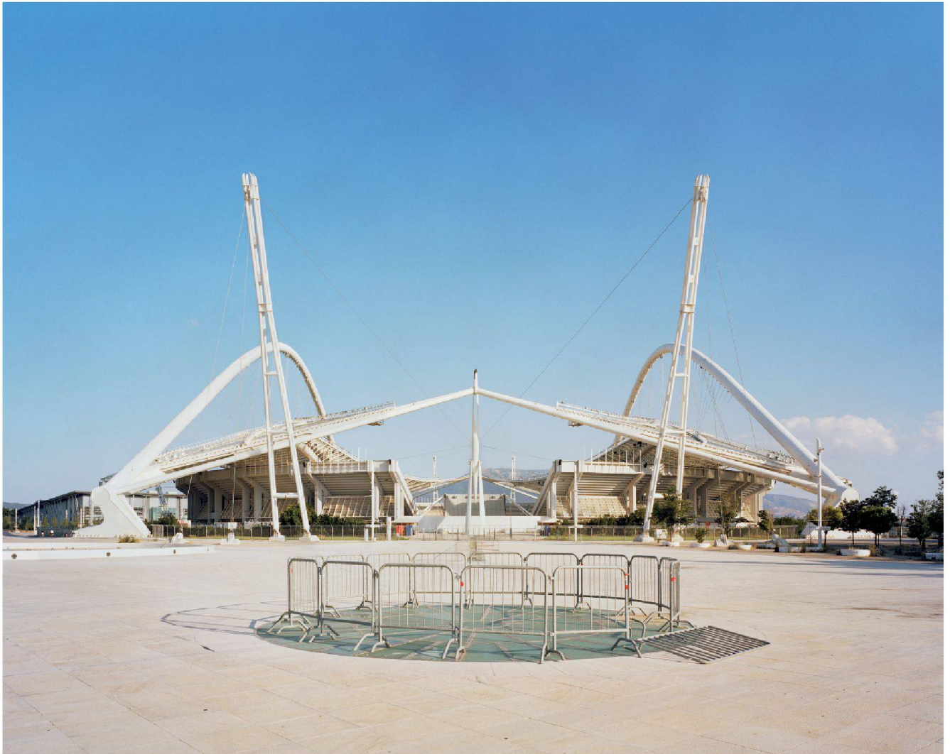
Fig. 14: Le stade olympique fait partie du complexe olympique d'Athènes. Situé dans le quartier de Maroussi à Athènes, c'est le principal stade d'athlétisme des Jeux de 2004.