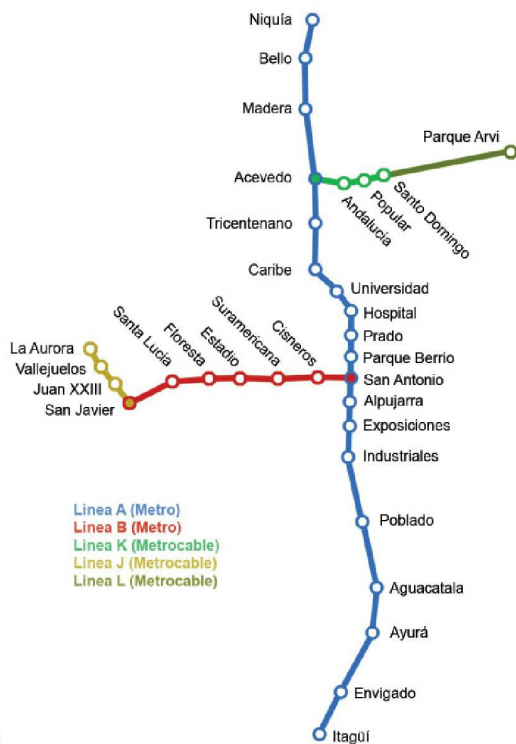
Fig. 3 : Vue d'un « Metrocable » à Medellin depuis une station de métro