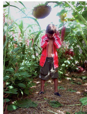
Les plantes à graines pour le domaine du Gaseau (F)