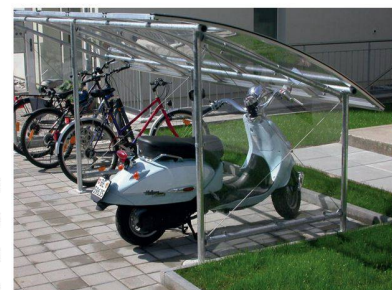
Real AG Uttigenstrasse 128 CH - 3603 Thoun < www.real-ag.ch >

Les abris en cadre acier (galvanisé à chaud ou peint sur demande selon les couleurs RAL) peuvent être équipés de couverture et parois latérales en plexiglas, en polycarbonate ou en verre. Ils peuvent ainsi être adaptés à des besoins personnalisés.