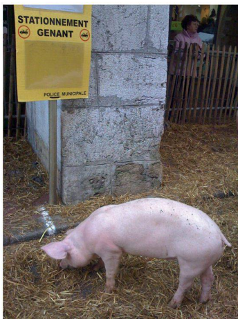
Mammifère helvétique