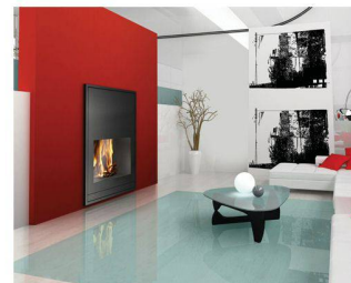
Rüegg Cheminée SA Schwäntenmos 4 CH - 8126 Zumikon < www.ruegg-cheminee.ch >

Au-delà des avancées esthétiques, Terza cumule de nombreux avantages pratiques. La télécommande permet d'ouvrir et de refermer la vitre sans quitter son fauteuil.