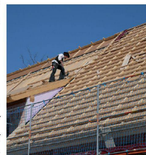
PAVATEX SA Route de la Pisciculture 37 CH - 1700 Fribourg < www.pavatex.ch >

Les visiteurs peuvent voir les solutions de systèmes mises en pratique sur la grande maison témoin du stand PAVATEX . Elle montre les solutions de rénovation de PAVATEX qui permettent aux bâtiments les plus anciens d'atteindre les standards énergétiques les plus récents.