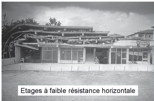
Etages à faible résistance horizontale