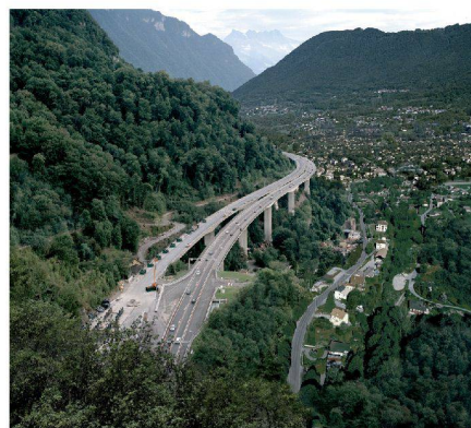
Autoroute A9, au-dessus de Chillon, VS à Evian, photomontage